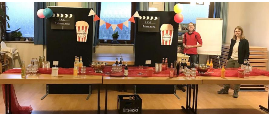
Warten auf die Kinogäste